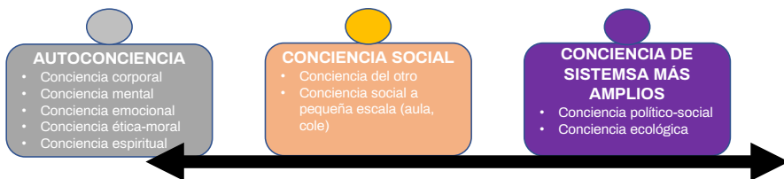
Figura 1. Ámbitos de aplicación de la conciencia. Fuente: Goleman y Senge (2016).

El neurocientífico Damasio (2010) conceptualiza la conciencia como “la capacidad de darse cuenta de la realidad”. Análogamente la define Calle (2017), maestro de yoga y gran conocedor de la tradición meditativa de la India, al expresar que “la conciencia es la capacidad de darse cuenta, de percibir y percibirse, de conectarse con el aquí-ahora a través de la poderosa energía de la atención”. Herrán (1998) propone un sistema para ordenar clasificaciones de estados de conciencia, reuniéndolos en siete grupos. Por su parte, Goleman y Senge (2016) clasifican la conciencia en tres ámbitos de aplicación, diferenciando entre autoconciencia o conciencia de sí, conciencia del otro y conciencia de sistemas más amplios, diferenciando subámbitos (Figura 1):