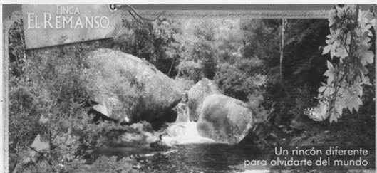
Un rincón diferente para olvidarte del mundo

PADMASANA CENTER C/ Mar de Oman, 34 Madrid Tf. 91 38 22 27 33 www.padmasanacenter.com