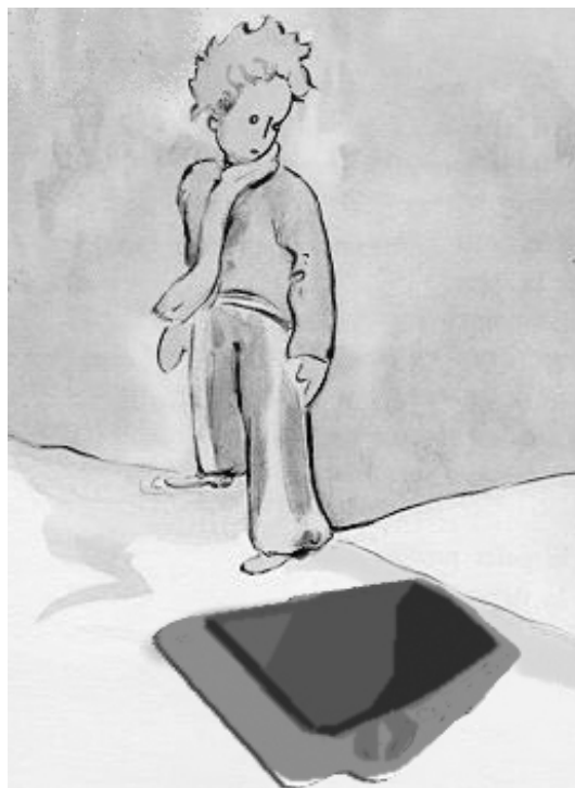
Fig.1: ¿Cómo la ves?

La TV es uno de los medios de comunicación de mayor influencia. ¿Pero influencia para qué? Para lo que se decida hacer y transmitir. Por ejemplo: en Nueva Zelanda, Bolivia o Zimbawe - por citar algunos lugares conocidos-, se sabe de algunas ciudades españolas merced a la liga de fútbol... G. Sartori (2003) ha definido a la televisión como la más grande agencia de formación de la opinión pública (p. 27). Su punto de vista acerca de este medio de comunicación es que: “la televisión ha entrado en una carrera competitiva decadente cuyo producto final es, primero, una información reducida; segundo, información improvisada e inútil, y tercero, una desinformación absoluta” (p. 33).